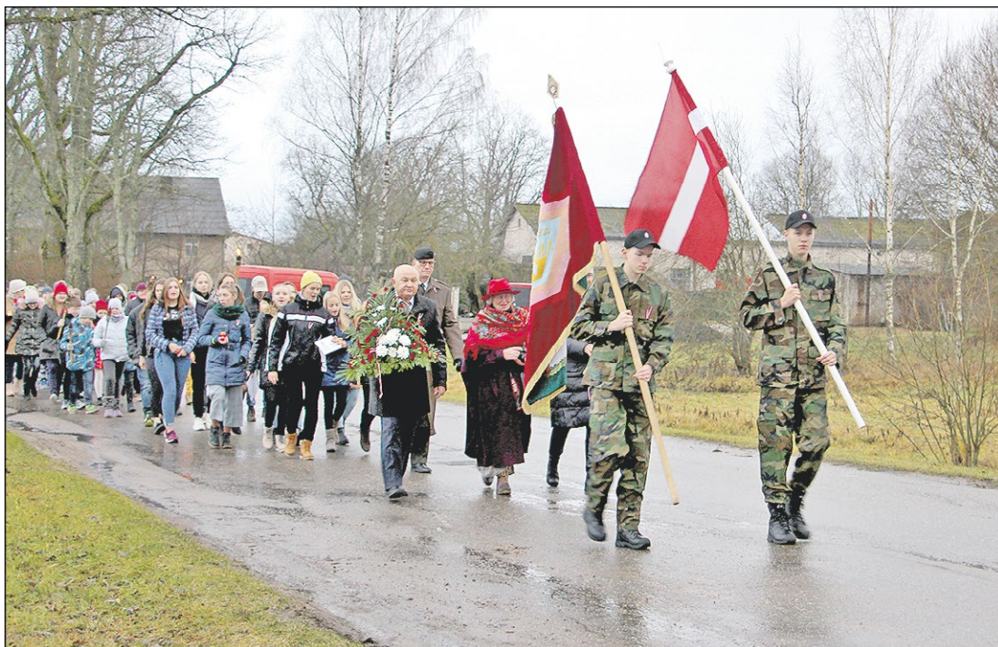
Lāpu gājiens Stalbē.

Iluta Beķere, sabiedrisko attiecību un jaunatnes lietu speciāliste, Attīstības plānošanas nodaļa