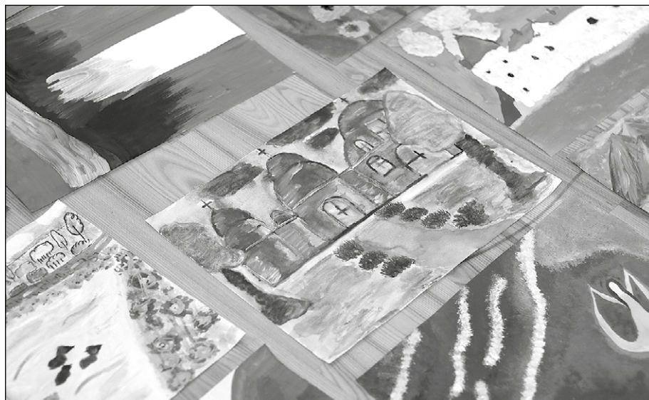
Bērnu zīmējumi.

Pārgaujas novada pašvaldība saka lielu paldies Pārgaujas novada izglītības iestādēm par atsaucību un dalību konkursā. Īpašs paldies A. Bieziņa Raiskuma pamatskolai par viesmīlīgo uzņemšanu, kā arī Latvijas Pašvaldību savienībai par atbalstu konkursa norisei.