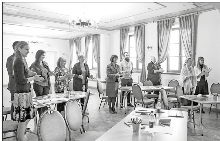
Apmācību dalībnieki.

Šajā gadā uzņēmējiem tika piedāvāts seminārs par tēmu "Radošums un inovācija jaunu