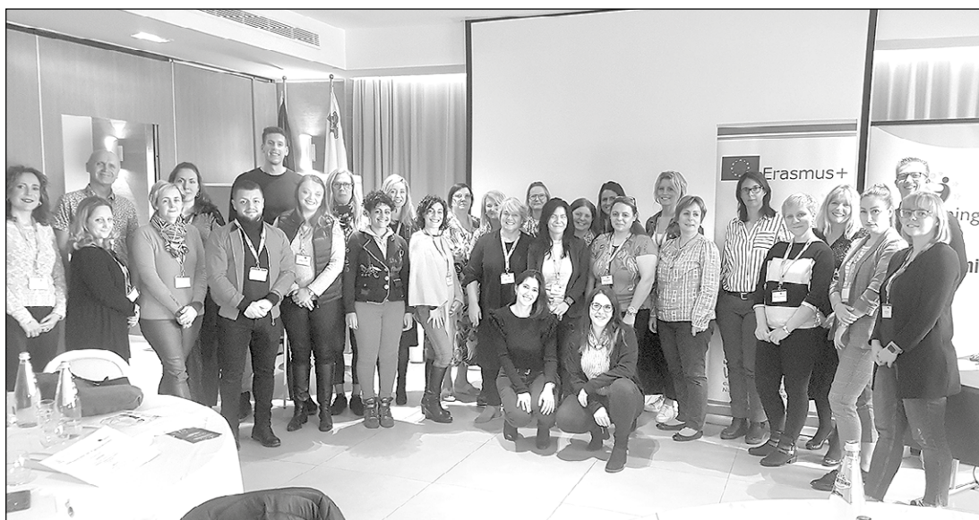
Starptautisko mācību dalībnieki.