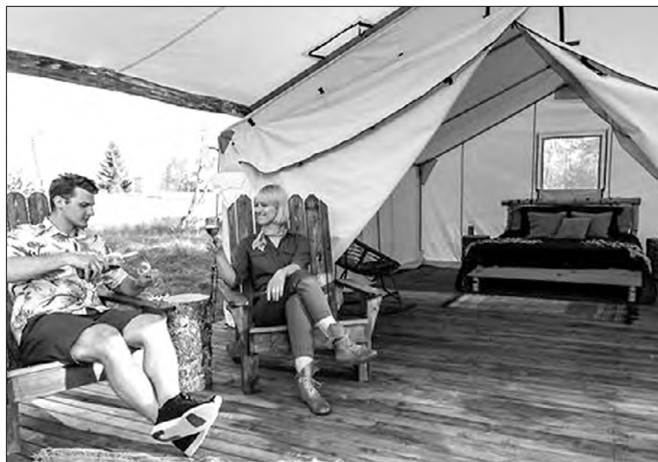
"Wild'ness Retreat & Studio" atpūtniekiem elegantās teltīs piedāvā baudīt mieru un klusumu.