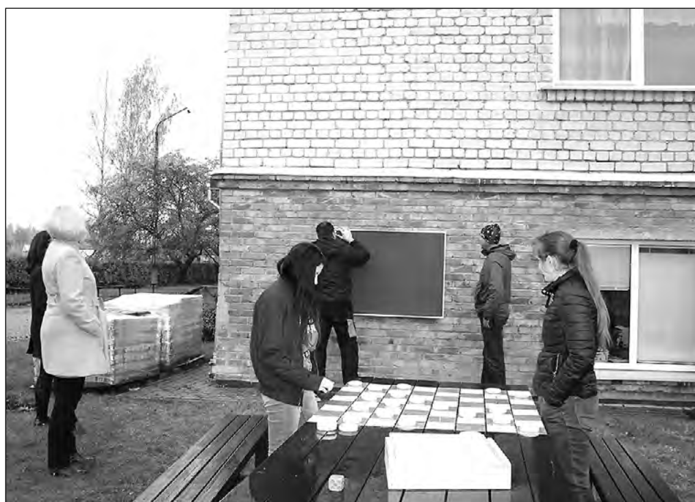
Zaļās klases tapšanas process.

Šī gada vīrusa ierobežojumu dēļ ar visu netikām galā, tāpēc plānoto bruģa ieklāšanas talku