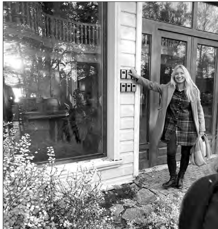
Viesu namā "Ungurmalas" izveidota parocīga iekļūšanas sistēma.