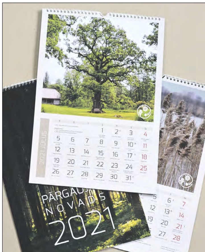
Pārgaujas novada pašvaldības izdots sienas kalendārs 2021. gadam.

Iluta Balode, sabiedrisko attiecību un jaunatnes lietu speciāliste, Attīstības plānošanas nodaļa