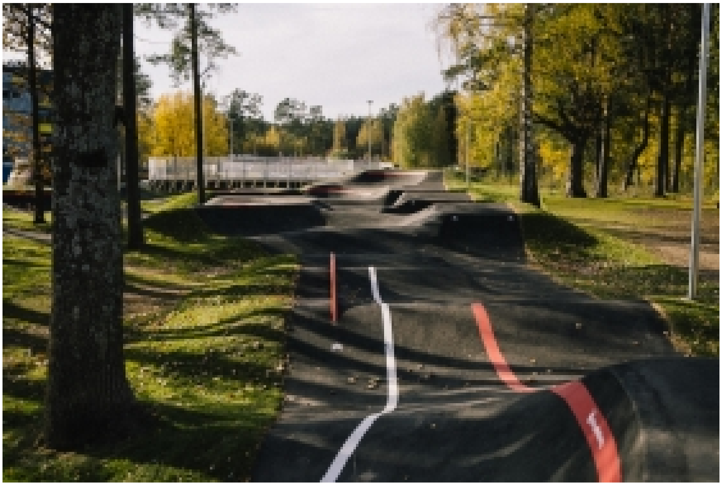
Harstad veloparks Norvēģijā